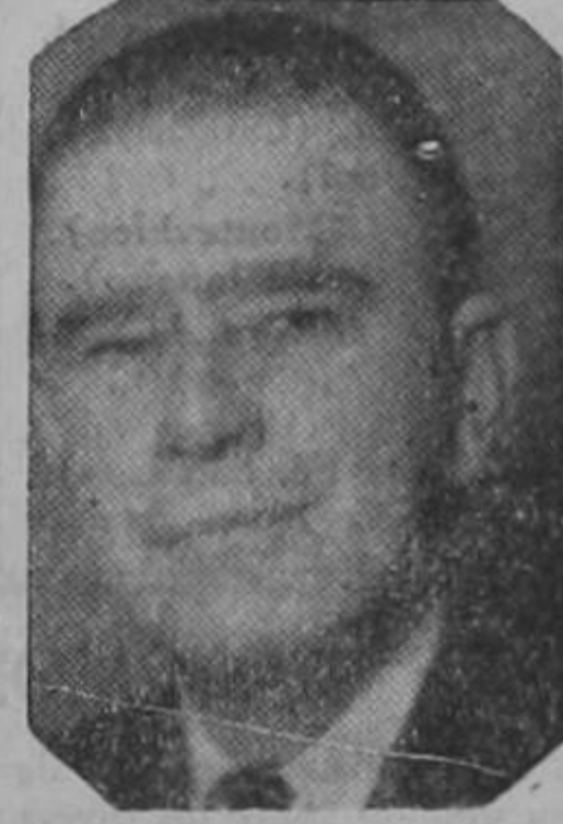
Sr. don Otilio Ulate Blanco Presidente de la República.

Pero, en oportunidades especiales si buscamos esas declaraciones, tratando en lo posible de apartarnos del tópico común. El cumplir nuestro primer lustro de vida fué un motivo. Y don Otilio, con esa su gentileza e interés constante por el general sentir de sus gobernados, departió largamente con nosotros comentando varios tópicos de general interés, algunos de los cuales reconstruimos para nuestros lectores.